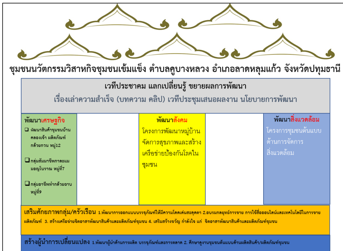
ภาพที่ 4 รูปแบบกิจกรรมการพัฒนาชุมชนนวัตกรรมตำบลคูบัวบางหลวง

จากภาพที่ 3 สรุปได้ว่าการดำเนินงานโครงการยกระดับคุณภาพชีวิตชุมชนและท้องถิ่นสิ่งแวดล้อม และวัฒนธรรม มหาวิทยาลัยสามารถดำเนินการได้ทั้งหมด 3 ประเด็นตามรายละเอียดในภาพ เพื่อมุ่งเน้นการสร้างผู้นำในการพัฒนาที่เรียกว่า “นวัตกรรมชุมชน” สร้างการเปลี่ยนแปลงผ่านกิจกรรมสร้างการเรียนรู้จิตอาสาเพื่อถ่ายทอดประสบการณ์จากผู้สร้างการเปลี่ยนแปลงชุมชนจากรุ่นสู่รุ่นเพื่อส่งเสริมคนรุ่นใหม่มีส่วนร่วมพัฒนาชุมชน ส่งเสริมการพัฒนาชุมชนนวัตกรรมวิสาหกิจชุมชนเข้มแข็งตำบลคูบัวบางหลวงในมิติการพัฒนาเศรษฐกิจ ดังนี้ (ภาพที่ 4)