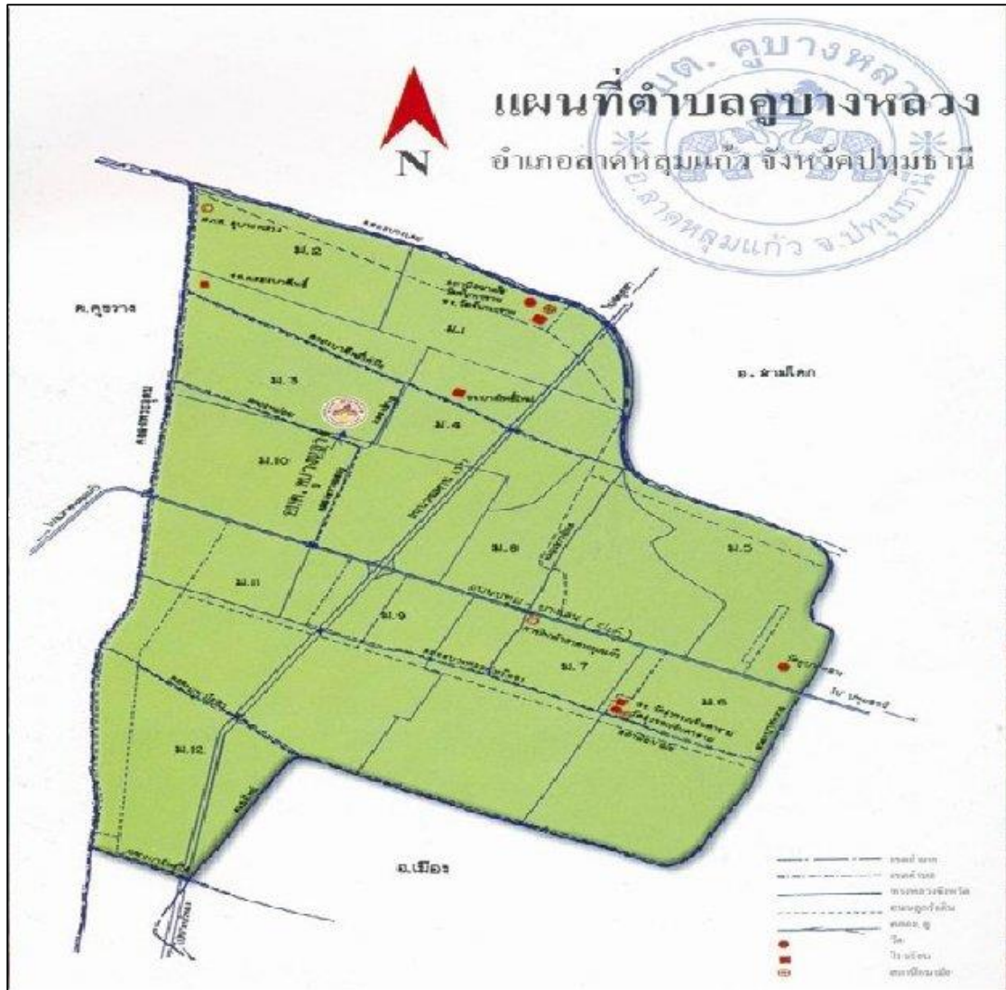
ภาพที่ 1 แผนที่ตำบลคูบัวหลวง อำเภอลาดหลุมแก้ว จังหวัดปทุมธานี