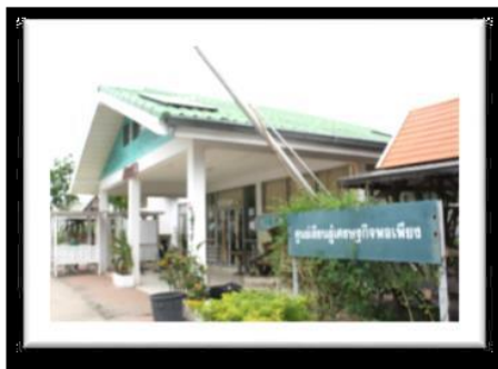
ศูนย์เรียนรู้เศรษฐกิจพอเพียง

จุดประสงค์การพัฒนาศูนย์การเรียนรู้ของสำนักส่งเสริมการเรียนรู้และบริการวิชาการ เพื่อให้ นักศึกษา อาจารย์ บุคลากร และประชาชนทั่วไป สามารถเข้ามาศึกษาหาความรู้ เพิ่มพูนทักษะด้านต่างๆ จาก การปฏิบัติจริงนอกห้องเรียน แลกเปลี่ยนประสบการณ์ ในการแก้ไขปัญหาชุมชนท้องถิ่น เป็นแหล่งรวบรวมองค์ความรู้ ในการถ่ายทอด เผยแพร่ ให้กับผู้เข้ามาศึกษาดูงาน สามารถกลับไปใช้ในแก้ปัญหาของชุมชนได้อย่างแท้จริง