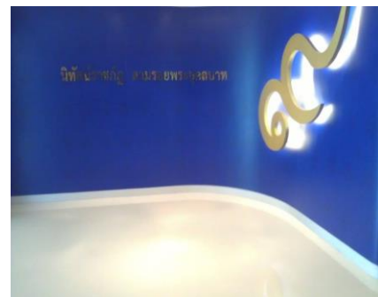
หอเฉลิมพระเกียรติ “นิตศันราชภัฏ”